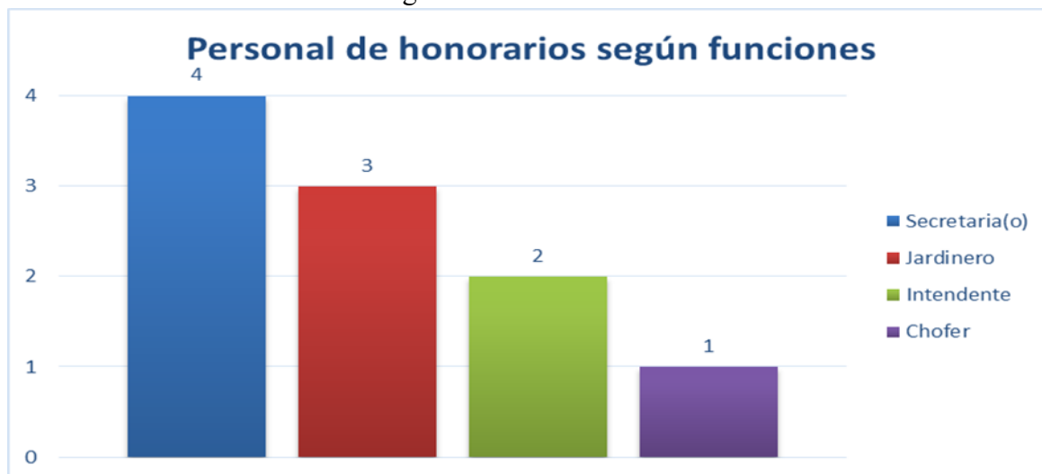
Gráfica 13. Personal de honorarios según funciones