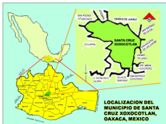
Figura 1. Localización del municipio de Santa Cruz Xoxocotlán, Oaxaca.

La UPN Unidad 201 se localiza en el estado de Oaxaca, al sureste de la República Mexicana en el municipio de Santa Cruz Xoxocotlán. Este municipio pertenece a la región de los valles centrales y al distrito del centro del Estado de Oaxaca. La distancia que hay entre el municipio y la capital del estado es de 5 kilómetros. Ver la figura 1.